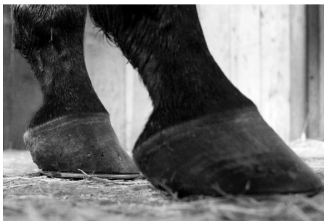
Fot. 1. Kopyta kończyn piersiowych konia od strony bocznej z piętami o różnej wysokości (kopyto prawe z niską piętka, kopyto lewe z wysoką piętka)

przez układ mięśniowo-szkieletowy, powodując pojawienie się usztywnień i bolesności w obrębie kończyn piersiowych, okolicy łopatek, szyi i grzbietu [25]. Zatem syndrom niskiej i wysokiej piętki doprowadza do zmiany postawy konia, braku równowagi pracy mięśni, spadku wydajności sportowej i trudności w poruszaniu się przy zmianie kierunków [30]. Może to też być przyczyną występowania jednostronnej kulawizny w zależności od różnicy wysokości pomiędzy piętami. Pogłębianie się problemów związanych z syndromem może w skrajnych przypadkach prowadzić do zmian patologicznych odcinka szyjnego kręgosłupa, potylicy oraz stawu lędźwiowo-krzyżowego lub wystąpienia kontuzji w obrębie dolnych partii kończyn [23].