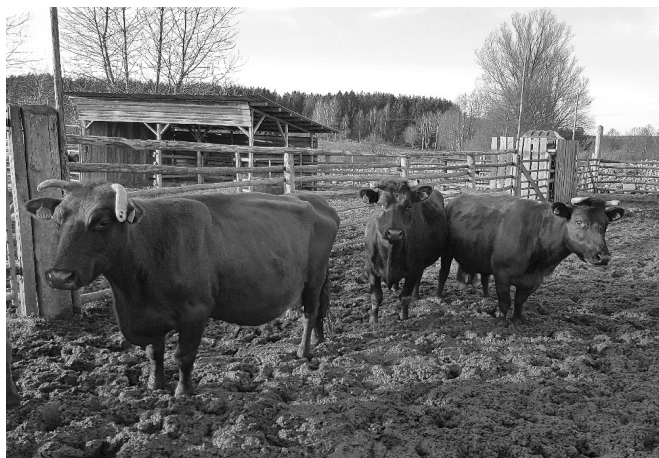
Fot. 1. Krowy rasy polskiej czerwonej w gospodarstwie Piotra Rydla i Agnieszki Prochal