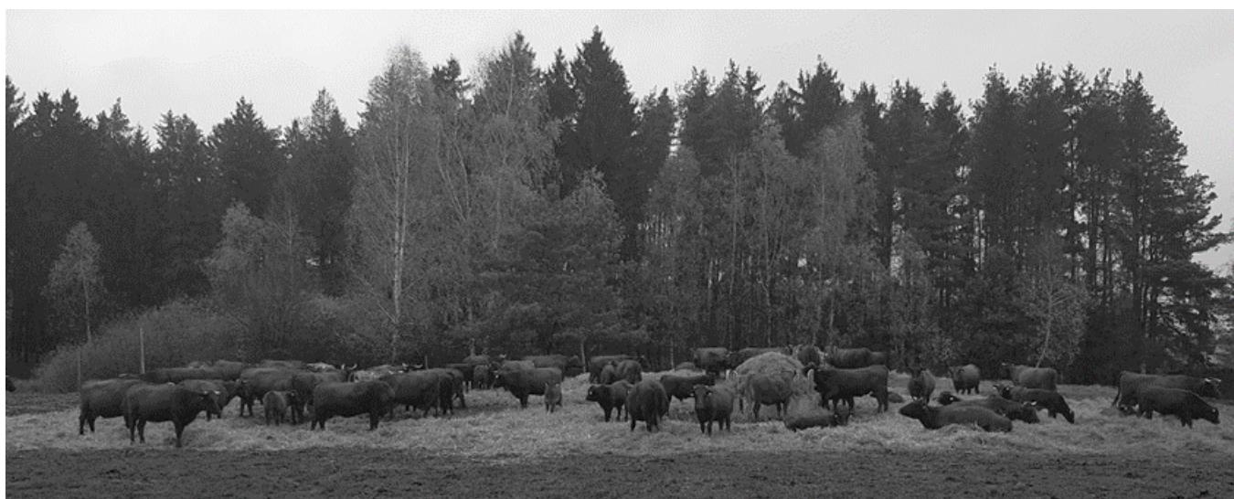
Fot. 2. Stado bydła rasy polskiej czerwonej w typie mięsnym w gospodarstwie Piotra Rydla i Agnieszki Prochal

siary w pierwszych godzinach po porodzie, wyrażoną gęstością powyżej 1,071 g/cm 3 i zawartością immunoglobulin klasy G powyżej 120,0 g/l. Jest to jedyna rasa krów, u której wraz z upływem czasu po porodzie jakość siary obniża się nieznacznie; u większości utrzymuje się na pograniczu klas dobrej i dostatecznej przez cały odchow cieląt. To sprawia, że większość hodowców preferuje pozostawianie cieląt z matkami nawet do 6 miesięcy. Weary i Chua [29] zaobserwowali, że cielęta pozostawiane przy matkach dzień lub 4 dni zamiast 6 godzin po urodzeniu rzadziej zapadały na choroby charakterystyczne dla tego okresu odchowu. Natomiast Flower i Weary [5] wykazali, że cielęta utrzymywane do 14. dnia życia przy mamkach charakteryzowały się 3-krotnie większymi dobowymi przyrostami masy ciała, w porównaniu do tych odsadzonych w 1. dniu.