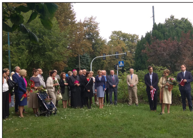
Fot. 2. Uroczystość na Skwerze im. Czesława Janickiego

PTZ, a w roku 2010 Walne Zebranie Członków Polskiego Towarzystwa Zootechnicznego przyznało Mu tytuł Honorowego Członka PTZ.