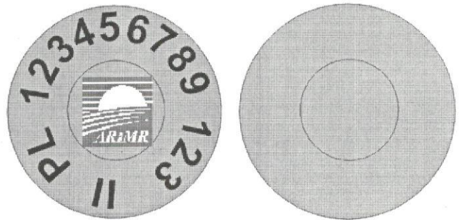
Rys. 4. Wzór duplikatu kolczyka dla świń

W przypadku uszkodzenia lub zagubienia przez zwierzę kolczyka, konieczne jest niezwłoczne złożenie (przez posiadacza) wniosku o wydanie jego duplikatu. Wniosek składa się w Biurze Powiatowym ARiMR, na formularzu udostępnionym przez Agencję. Duplikaty kolczyków posiadacz zwierząt za-