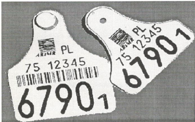
Rys. 2. Wzór kolczyka dla bydła