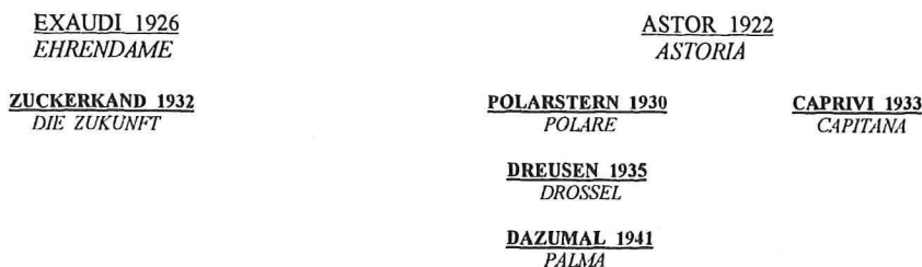
Rys. 4. Ród ogiera Wolkenflug