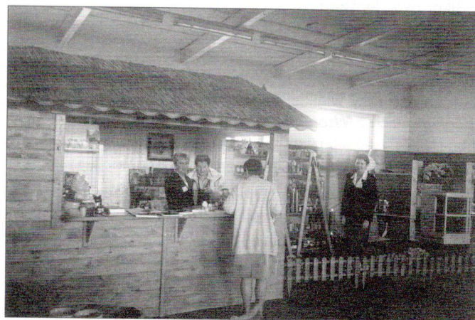
Fot. 3. Część ekspozycji pszczelarskiej

Na XVII Krajowej Wystawie Zwierząt Hodowlanych obejrzeć można było także ekspozycję pszczelarską. Na stoiskach zorganizowanych wspólnie z Wojewódzkim Związkiem