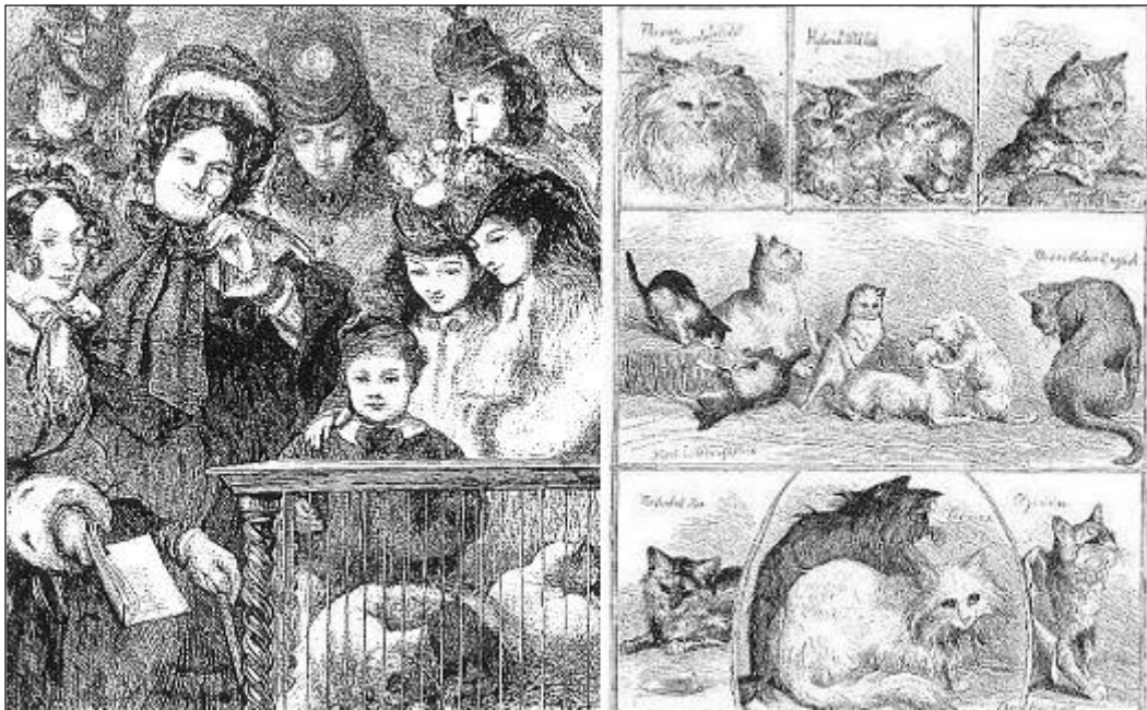
Fot. 5. Koty nagrodzone na wystawie w 1871 roku [9]. Na górze od lewej do prawej: perski (rzadki fioletowy kolor); dzikie hybrydy; srebrny pręgowany. Pośrodku od lewej do prawej: najlepsze mioty kociąt; angielski kot o kolorze myszy. U dołu od lewej do prawej: szylkretowy Tom; perski; abisyński.

kazano po raz pierwszy już na wystawie w 1871 r., stąd nie wzbudziły takiego zainteresowania jak oceloty.