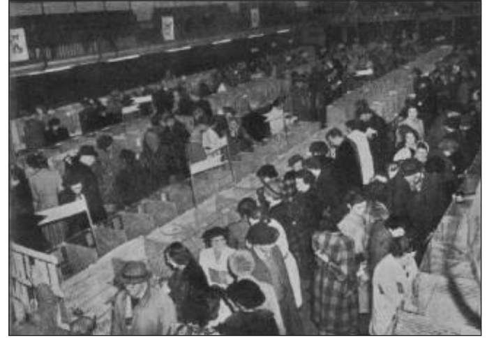
Fot. 4. Pokaz kotów w Londynie w 1948 roku [9]

syjski, syjamski), jak również brytyjskie (shorthairs, manx). Pokaz przyciągnął 170 wystawców, którym przyznano 54 nagrody. Tak duża liczba nagród okazała się zachętą dla przyszłych uczestników konkursów. Nagrody wręczono właścicielom zwierząt, wśród których było: 32 panów, 15 mężatek i tylko 4 panny. Taki układ zwycięzców i tym samym wystawców sugerował, iż mitem jest stwierdzenie: „koty to zwierzęta należące do starych panien”. Większość wystawców stanowili zamożni Brytyjczycy, więc podobnie jak klasy dla kocich ras, ustanowiono również specjalną klasę dla „Kotów Należących do Człowieka Pracy” [3, 8]. Większość odmian oceniana była według ścisłych reguł ustalonych przez Harrisona Weir’a. Oceniano także koty w klasach tzw. ciekawostkach, które obecnie nie istnieją, na przykład przyznano nagrodę dla najgrubszego i największego kota. Otrzymał ją kocur o masie ciała 20 funtów (1 lb ≈ 0,453 kg). Zaprezentowano także po raz pierwszy dwa koty syjamskie. Jeden z pisarzy określił je, jako „nienaturalny rodzaj kota”, a inny, że były one „eleganckie w swojej gładkości skóry”. Najbardziej zachwycił wszystkich kociak rasy perskiej (fot. 5).