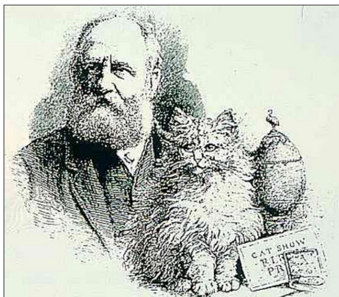
Fot. 1. Harrison Weir (1824-1906) – „The Father of the Cat Fancy” [3]

Koty nie tylko wzbudziły zainteresowanie na Starym Kontynencie, zachwyciła się nimi również Ameryka. Około 1825 roku ludność Nowej Anglii (północno-wschodnia część USA) zaczęła organizować targi wiejskie. Prezentowano tam zwierzęta, zwykle konie i bydło. Po pewnym czasie zaczęto pokazywać