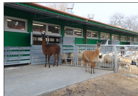
Laboratorium Mięsa i Produktów Mięsnych

Koniec realizacji Projektu BIO przewidziano na ostatni kwartał 2011 roku. Do tej pory na prace budowlane na Wydziale Bioinżynierii Zwierząt UWM wydał 8,4 mln zł i 10,2 mln zł na wyposażenie. Dzięki oszczędnościom w projekcie uczelnia wystąpiła także do Polskiej Agencji Rozwoju Przedsiębiorczości o zgodę na zakup dodatkowej aparatury przeznaczonej dla Ośrodka Oceny Produktów Pochodzenia Zwierzęcego.