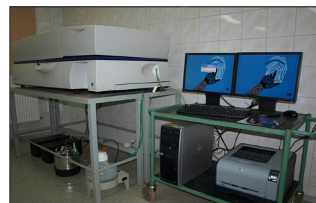
Laboratorium Kriokonserwacji Nasienia