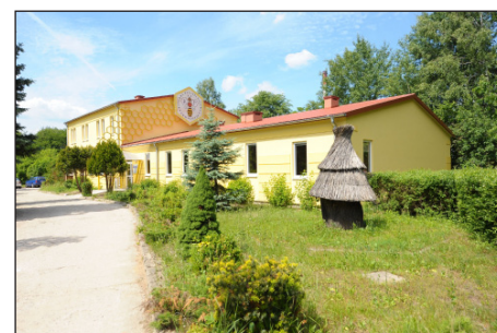
Laboratorium Monitoringu Jakości i Bezpieczeństwa Produktów Pszczelich